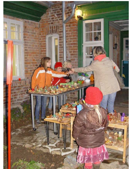
„Leuchte kleine Laterne“

Die kalte Jahreszeit hat begonnen. Die Menschen zünden wieder Kerzen und Laternen an und tragen die Lichter durch die herbstliche Dunkelheit. So auch die Kinder der Gemeinde Bröbberow. Am 30.10.2012 begrüßten die Schulkinder ihre Eltern und viele andere Besucher am Gutshaus mit einem musikalischen Programm. Sie verkauften Wunschlichter, selbstgebackenen Kürbiskuchen und Kürbissuppe für den guten Zweck (Aufbau des Generationentreffs in der Gemeinde).