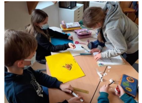
Am 9. April: So gestalte und präsentiere ich ein Plakat – Gruppenarbeit zum Thema „Küken“.