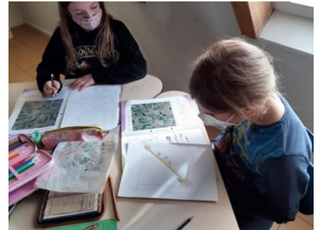
32. Schulwoche: „Wo wir wohnen“ – Die Schüler zeichnen Landkarten.