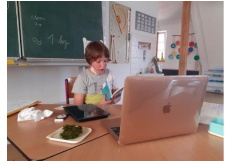
Ab 12. April: Schülerinnen lesen begeistert aus unserem Ringbuch Rosie und Moussa .