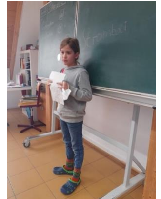
Im Mai: „Experimentieren & beschreiben“ und Vorträge halten