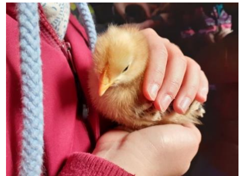
Am 8. April: Besuch bei Lili und ihren Küken anlässlich unseres Projektes „Vom Ei zum Küken“